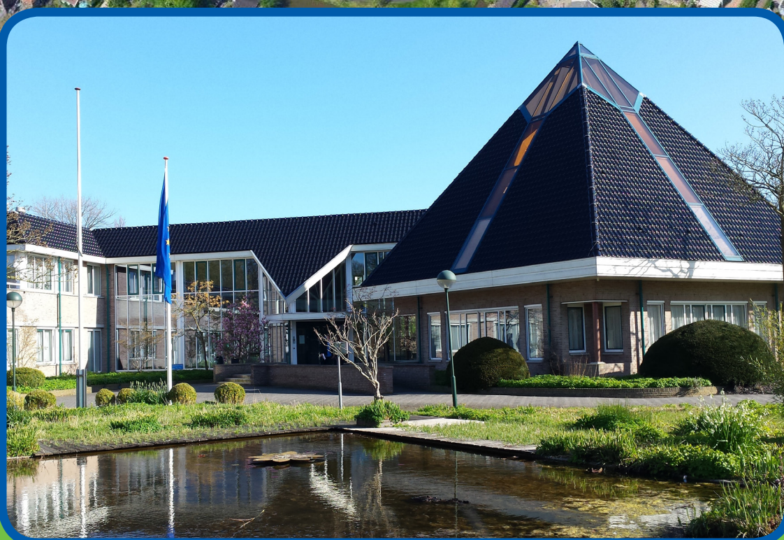
gemeentehuis en het park daaromheen

ruimte voor wonen, zorg of kantoor in een parkachtige omgeving