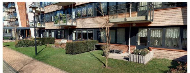
referentie voor de overgang buitenruimte en park